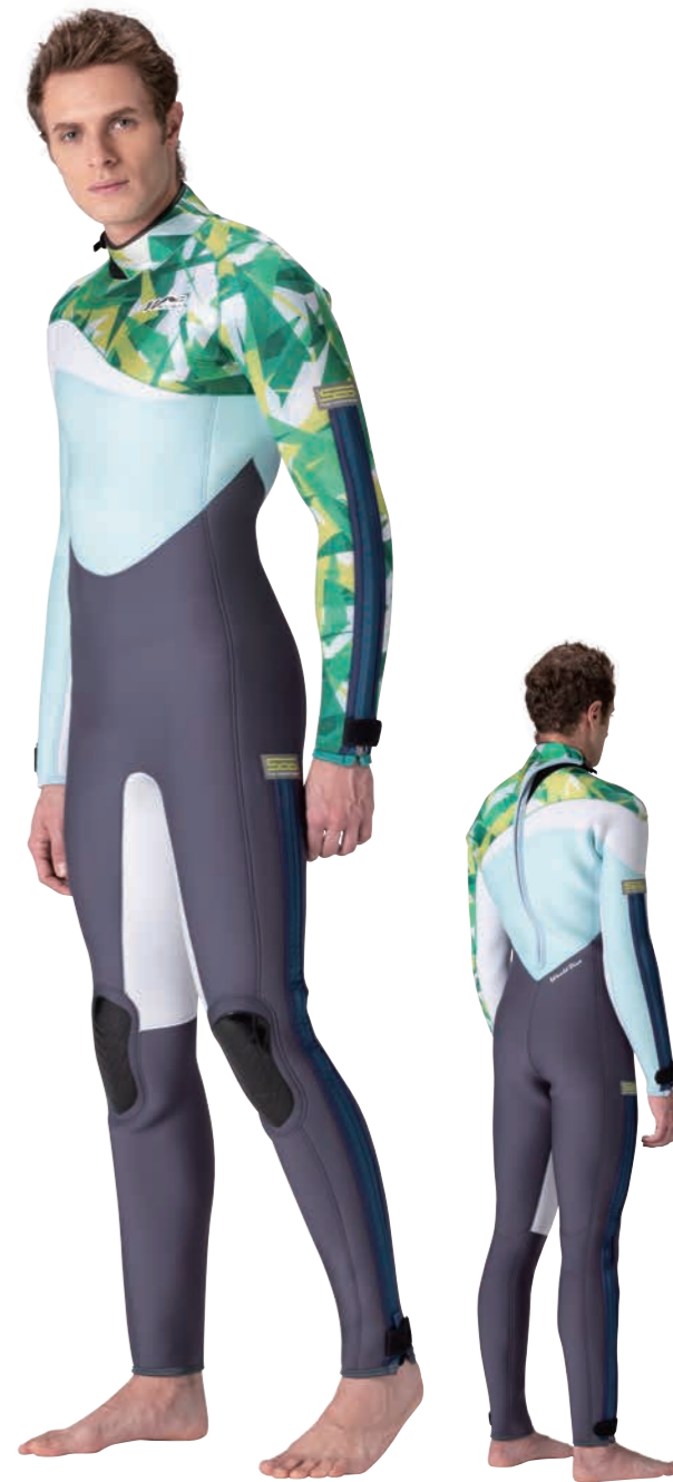
▲チャコールグレイ (FE) × アイスブルー (FE) × クリスタルグリーン (P) × ホワイト (FE) +ファスナー・インディゴブルー×SCDワッペン・グリーン