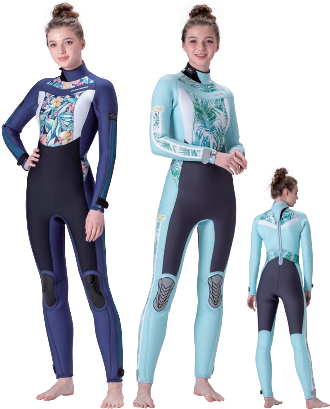
▲ネイビー (FE) × トロピカル (P) × ホワイト (FE) × ブラック (FE) +ファスナー・インディゴブルー×SCDワッペン・ブラック