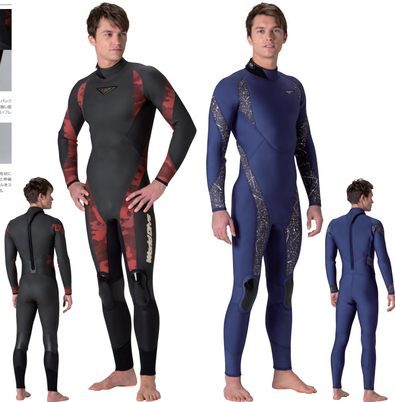
▲ダークカモレッド(P)×ブラック(ZF)

ドットステンシル ウレタン樹脂素材をドット形状にコーティングし耐摩耗性と伸縮性に優れたドットステンシルをスネとふくらはぎ部分に採用。