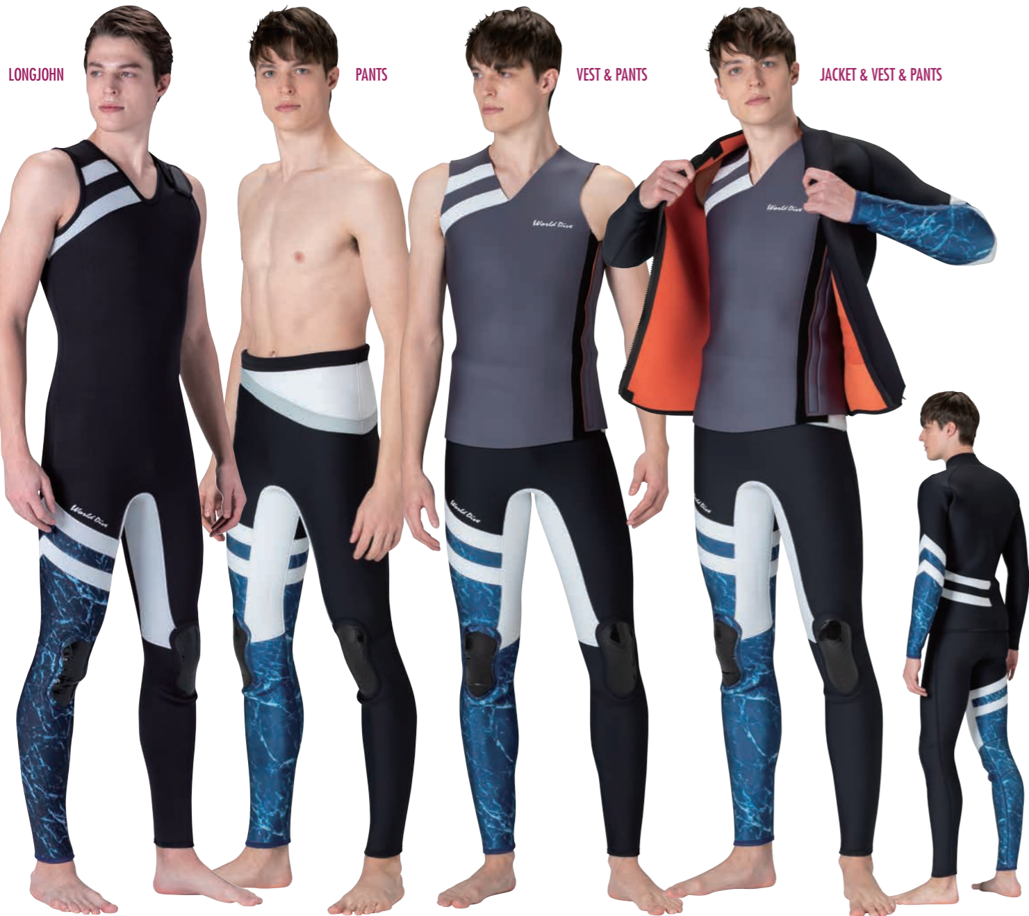
●ロングジョン ブラック(SJ)×ホワイト(SJ)×マーブルネイビー(P) ●パンツ ブラック(SJ)×ホワイト(SJ)×マーブルネイビー(P) ×シルバー(SJ)×ホワイト(SJ) ▲2ピース ●ベスト:チャコールグレイ(SJ)×ホワイト(SJ) ●ベスト:チャコールグレイ(SJ)×ホワイト(SJ) ●パンツ:ブラック(SJ)×ホワイト(SJ)×マーブルネイビー(P) ▲3ピース ●ジャケット:ブラック(SJ)×ホワイト(SJ)×マーブルネイビー(P) ●ベスト:チャコールグレイ(SJ)×ホワイト(SJ) ●パンツ:ブラック(SJ)×ホワイト(SJ)×マーブルネイビー(P)

メンズのためのリゾートカジュアルウエットスーツ。シーンにあわせて遊びゴコロも一緒にセットアップしよう。