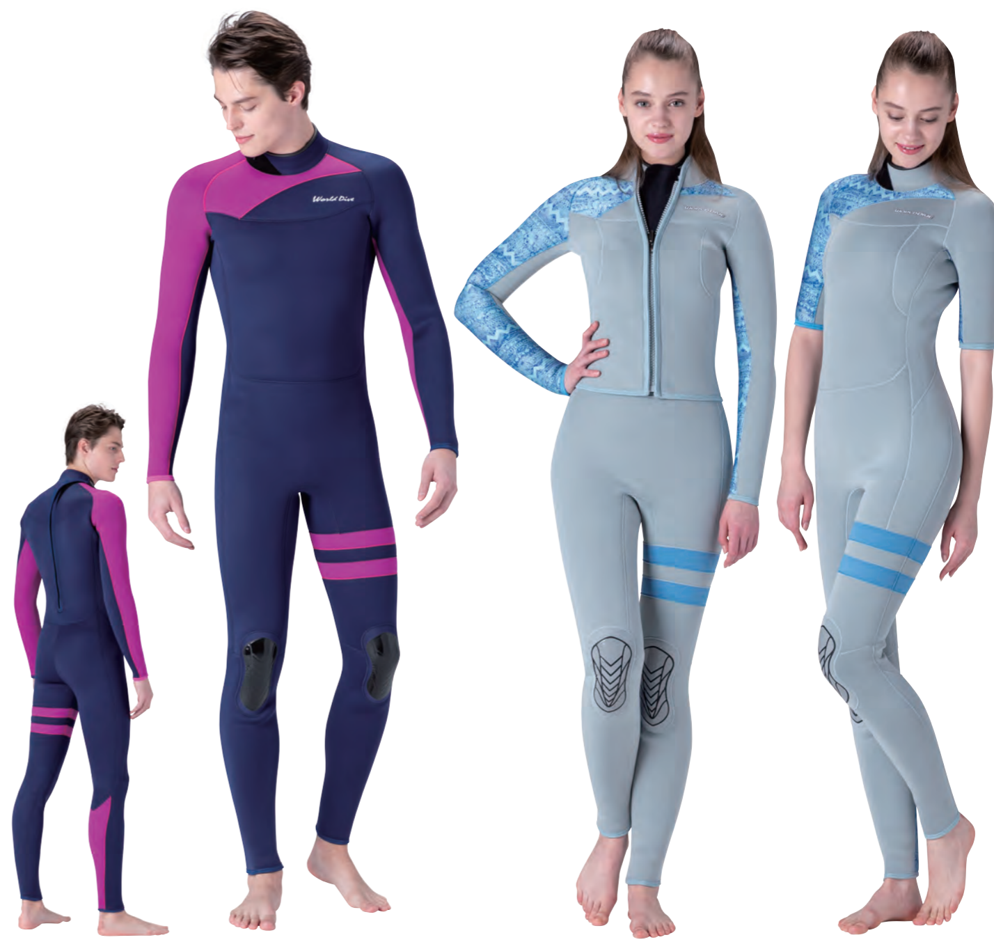
▲ネイビー (SJ) × バイオレット (SJ) × バイオレット (SJ)