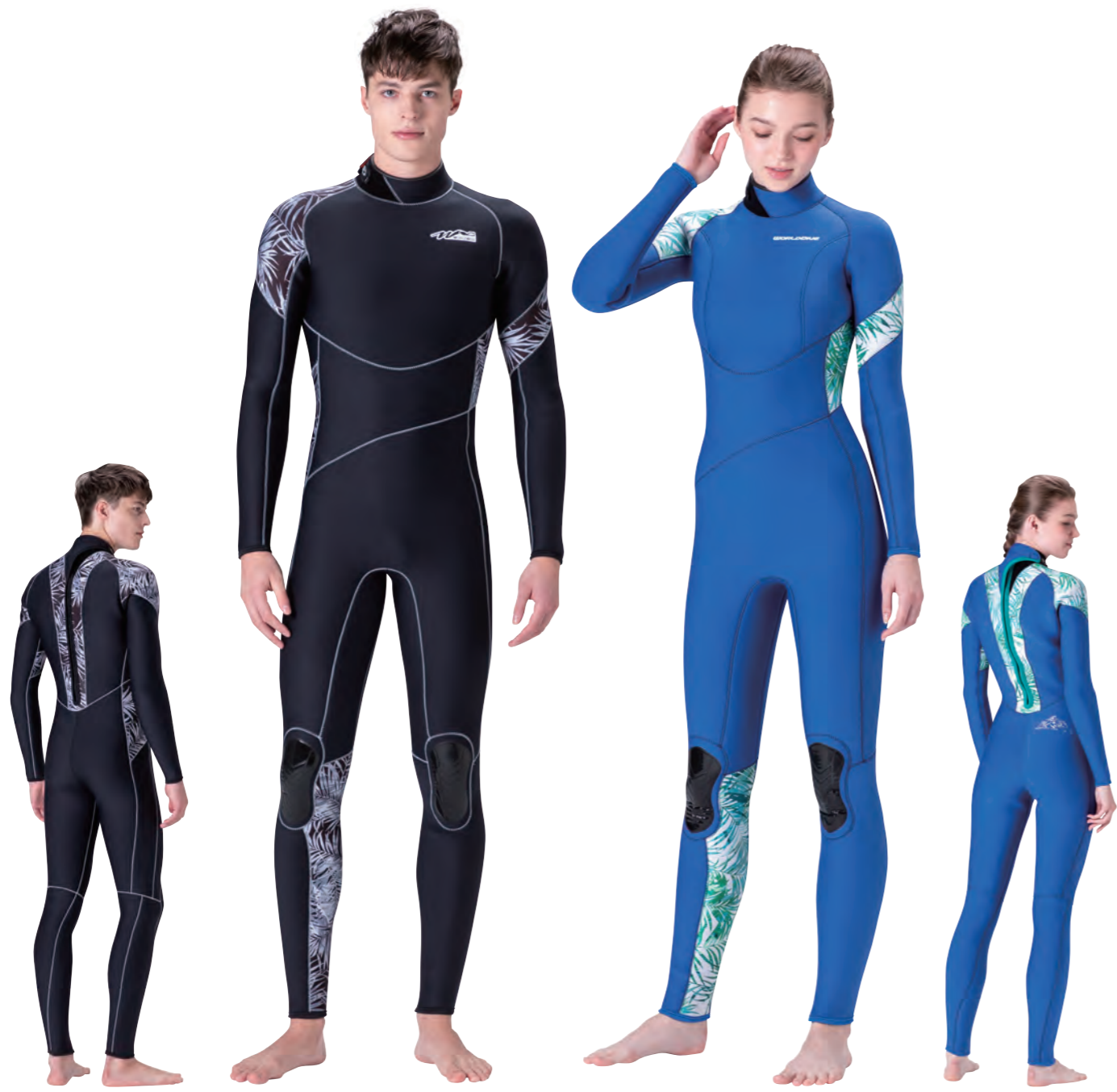
▲ブラック (FE) × パームモノ (P) × ステッチカラー: シルバー