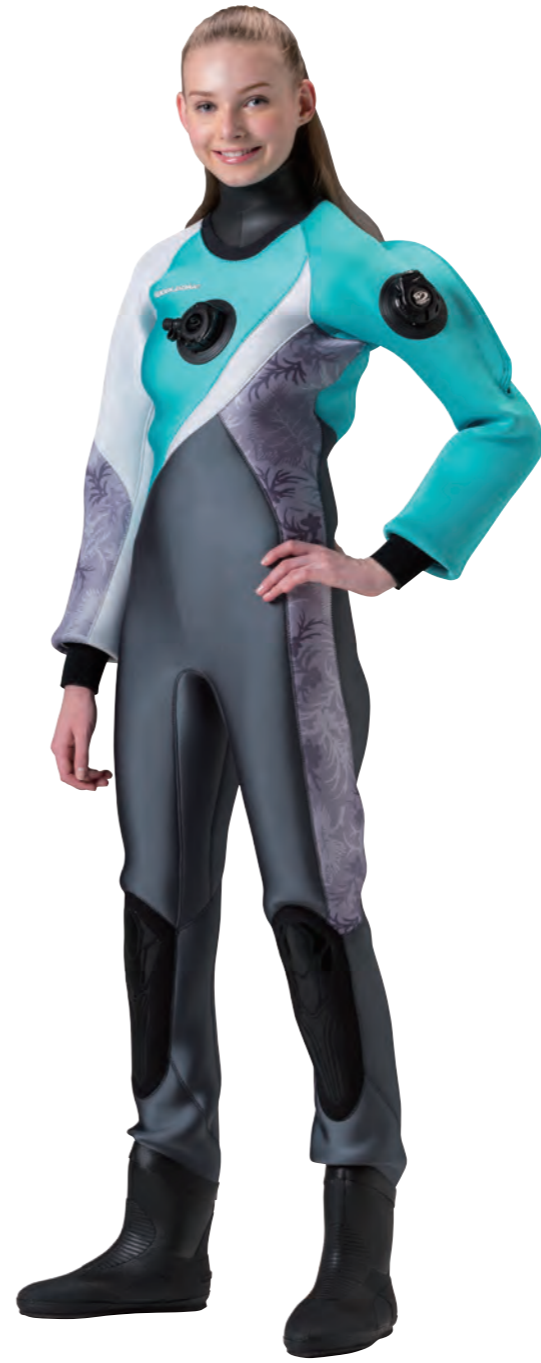
▲ネオグレイ(G)×ピスタチオ(G)×ボタニカルグレイ(P)×ホワイト(G) ■マーク：右胸・M5-2 シルバー 右腰・M6-2 シルバー