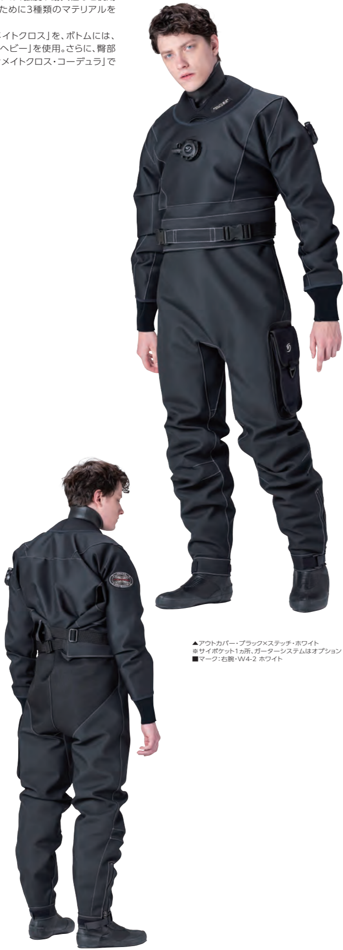
▲アウトカパー・ブラック×ステッチ・ホワイト ※サイポケット1ヶ所、ガーターシステムはオプション ■マーク:右腕・W4-2 ホワイト

ご注文から出荷まで3~4週間いただいております。製造ラインの混み具合によりさらにお時間をいただく場合もございます。予めご了承ください。