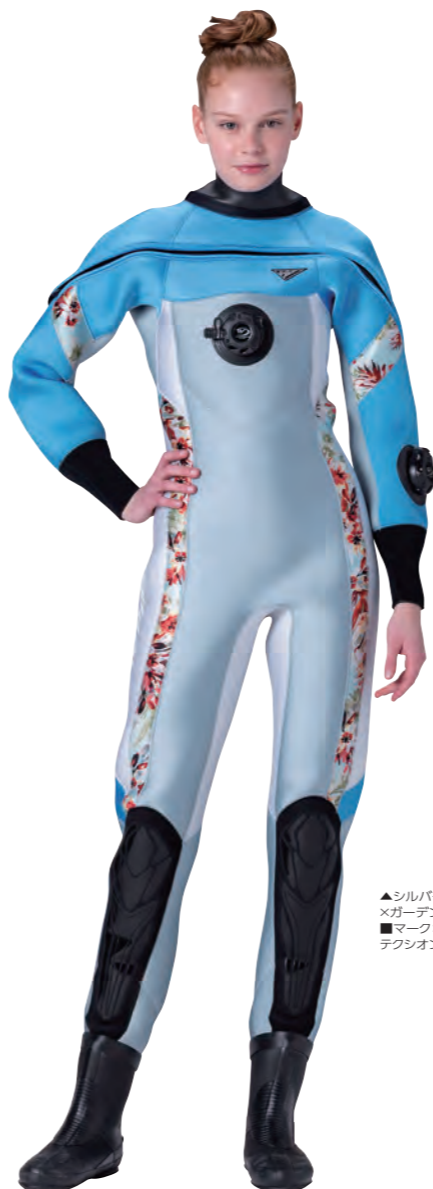
▲シルバー×ウォーター ×ガーデン×ホワイト ■マーク:M1-8A/2B テクシオンシルバー(小)