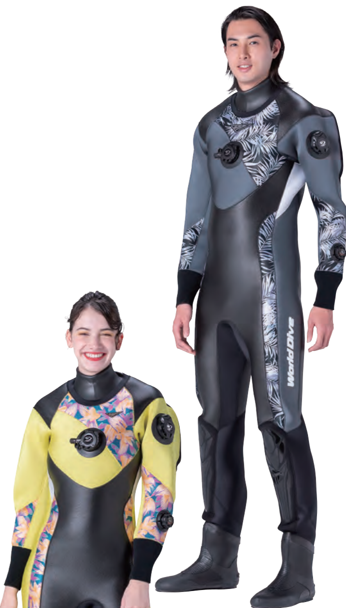
▲ネオグレイ×パール×モノ×ホワイト ■マーク:M1-8A/2B テクシオンシルバー