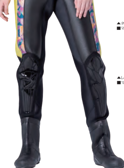
▲レモンイエロー×カトレア×エロー×ホワイト ■マーク:M1-9A/3B テクシオンゴールド(小)