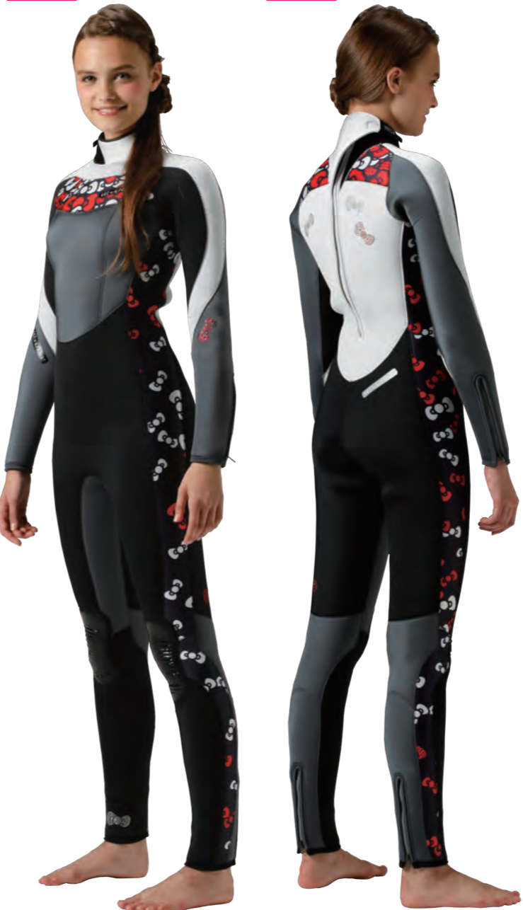
▲写真:デラックスモデル