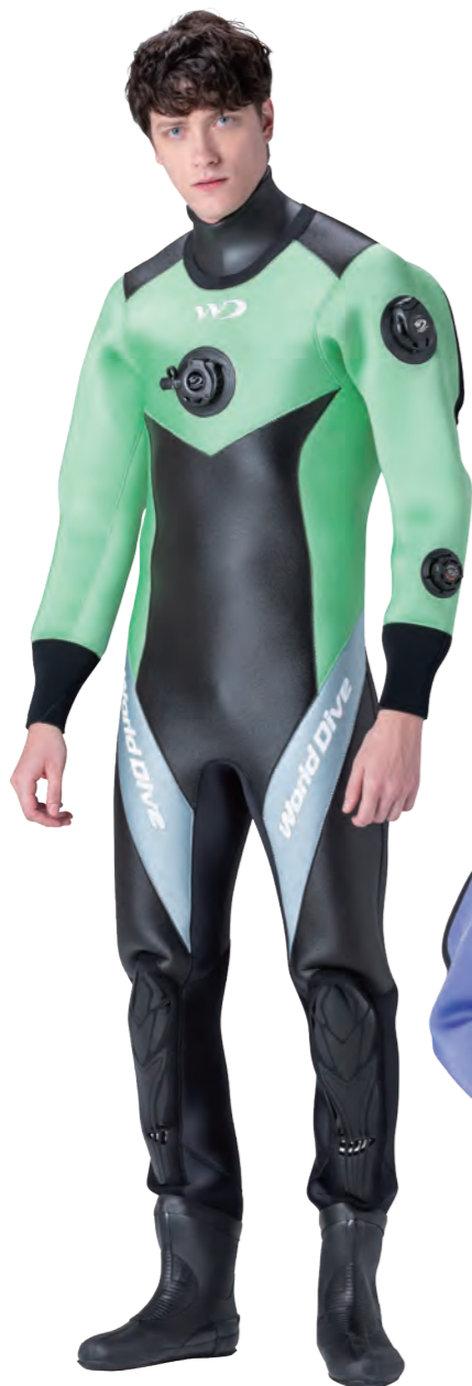
▲ミント×シルバー ■マーク:M1-2A/2B ホワイト