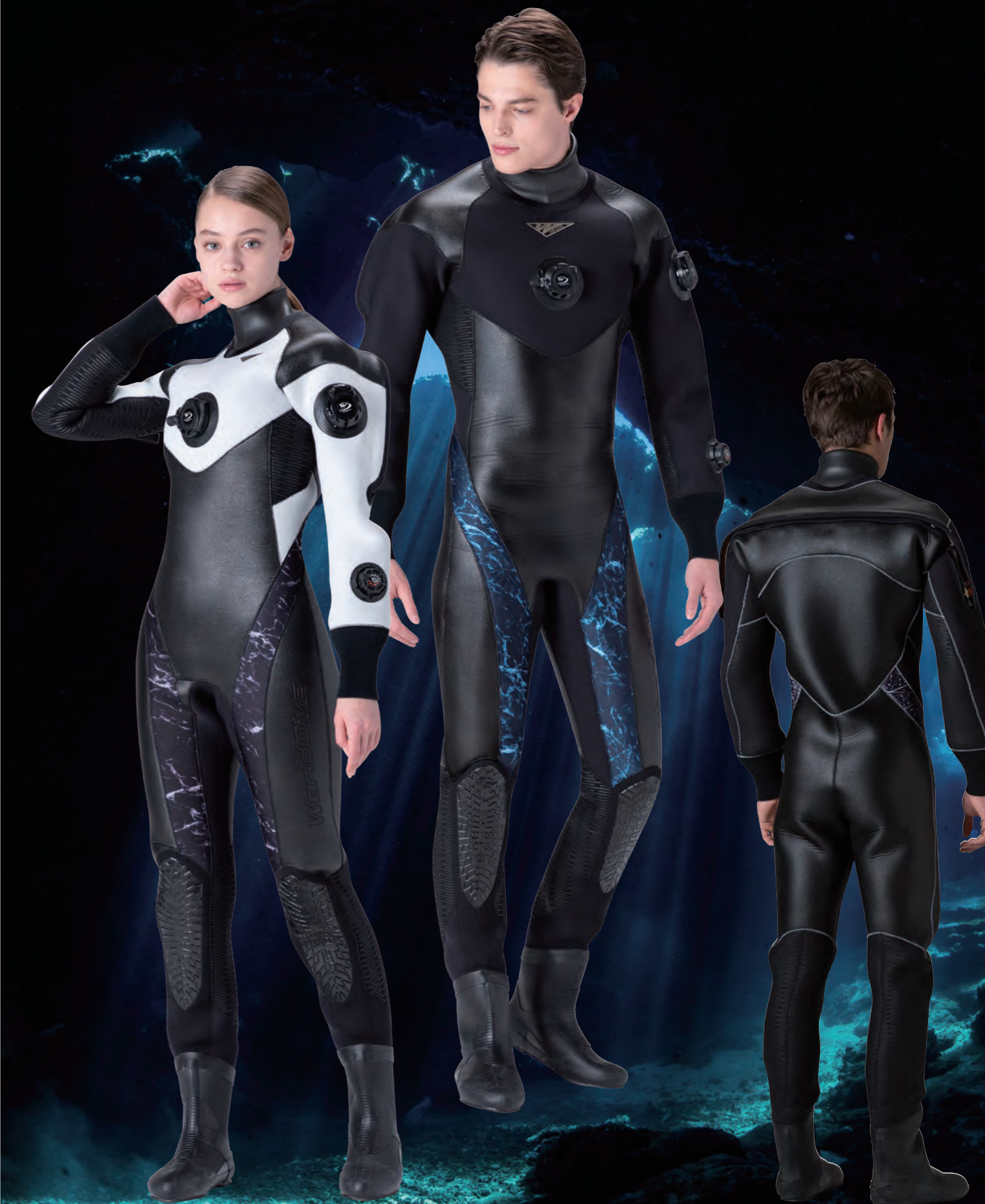
▲ホワイト×マーブルモノ×ステッチ・ブラック ■マーク・M1-8A テクシオンシルバー (小)

ダッシュプロテクトライン 耐久性のあるカノコジャージ×ウレタン樹脂コーティングで、耐摩擦性を高めた高強度高耐性のダッシュプロテクトラインを、脇下、腕裏、ふくらはぎなどに採用して、さらに強化しています。