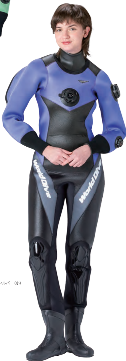
▲ブルーベリー×ネオグレイ ■マーク:M1-8A/2B テクシオンシルバー(小)

PRICE ▶ P77 3.5mm ¥243,000 (税込¥267,300) +フルサイズオーダー +¥25,000 (税込¥27,500)