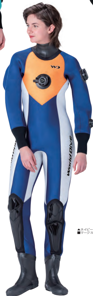
▲ネイビー×ネオオレンジ×ホワイト ■マーク:M1-1A/1B ブラック(小)

PRICE ▶ P77 3.5mm ¥224,000 (税込¥246,400) +フルサイズオーダー +¥25,000 (税込¥27,500)