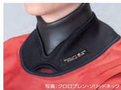
写真:クロロプレン・ソリッドネック