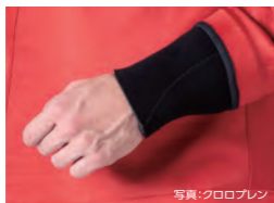
写真:クロロプレン