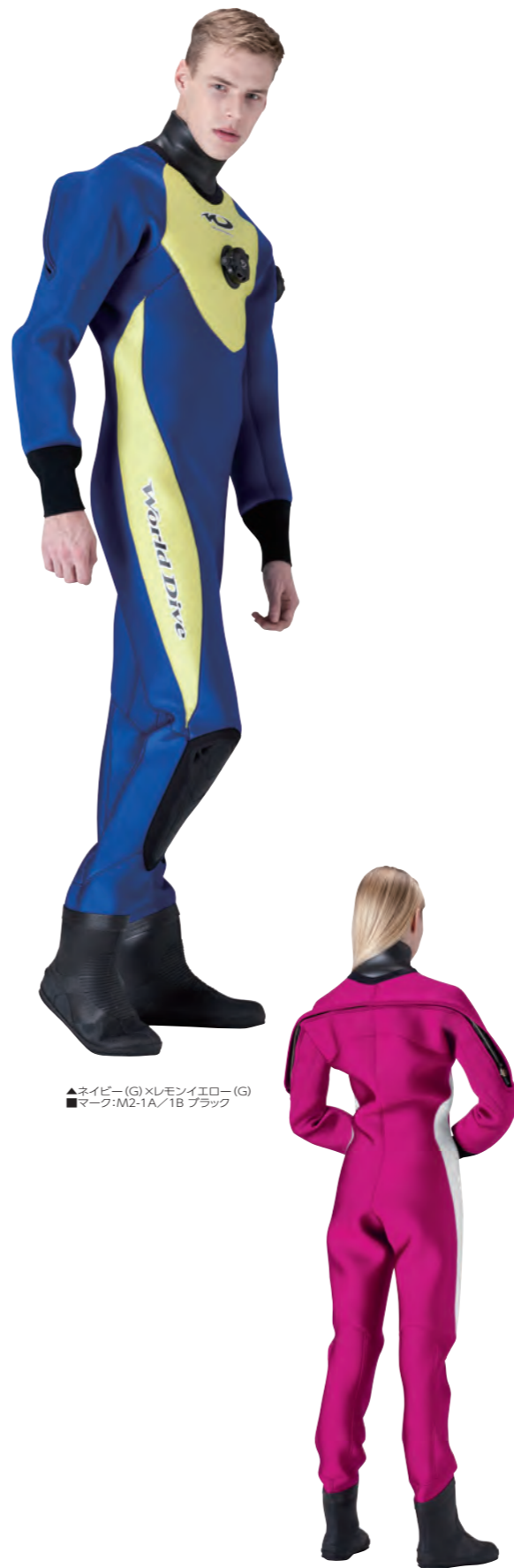
▲ネイビー(G)×レモンイエロー(G) ■マーク:M2-1A/1B ブラック