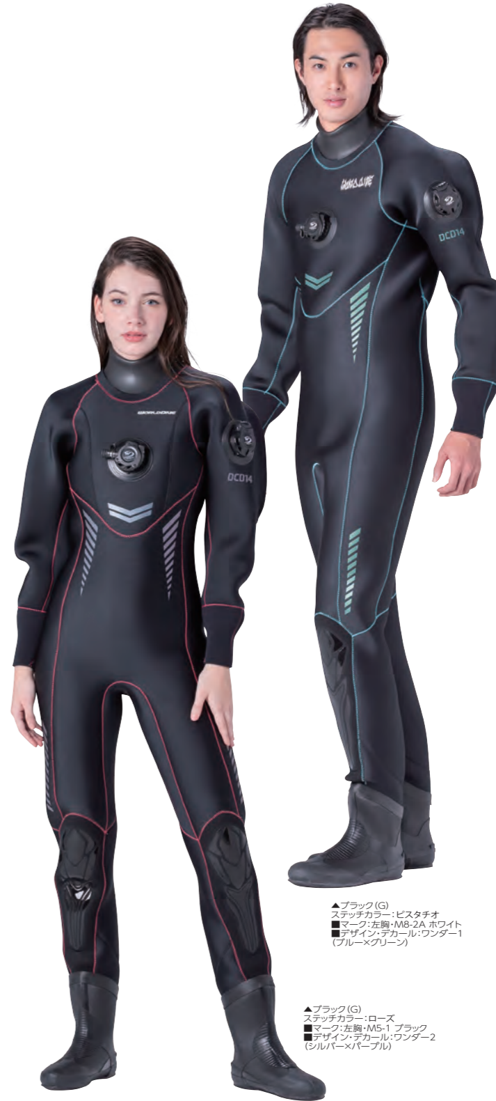
▲ブラック(G) ステッチカラー:ピスタチオ ■マーク:左胸・M8-2A ホワイト ■デザイン・デカール:ワンダー-1 (ブルー×グリーン)