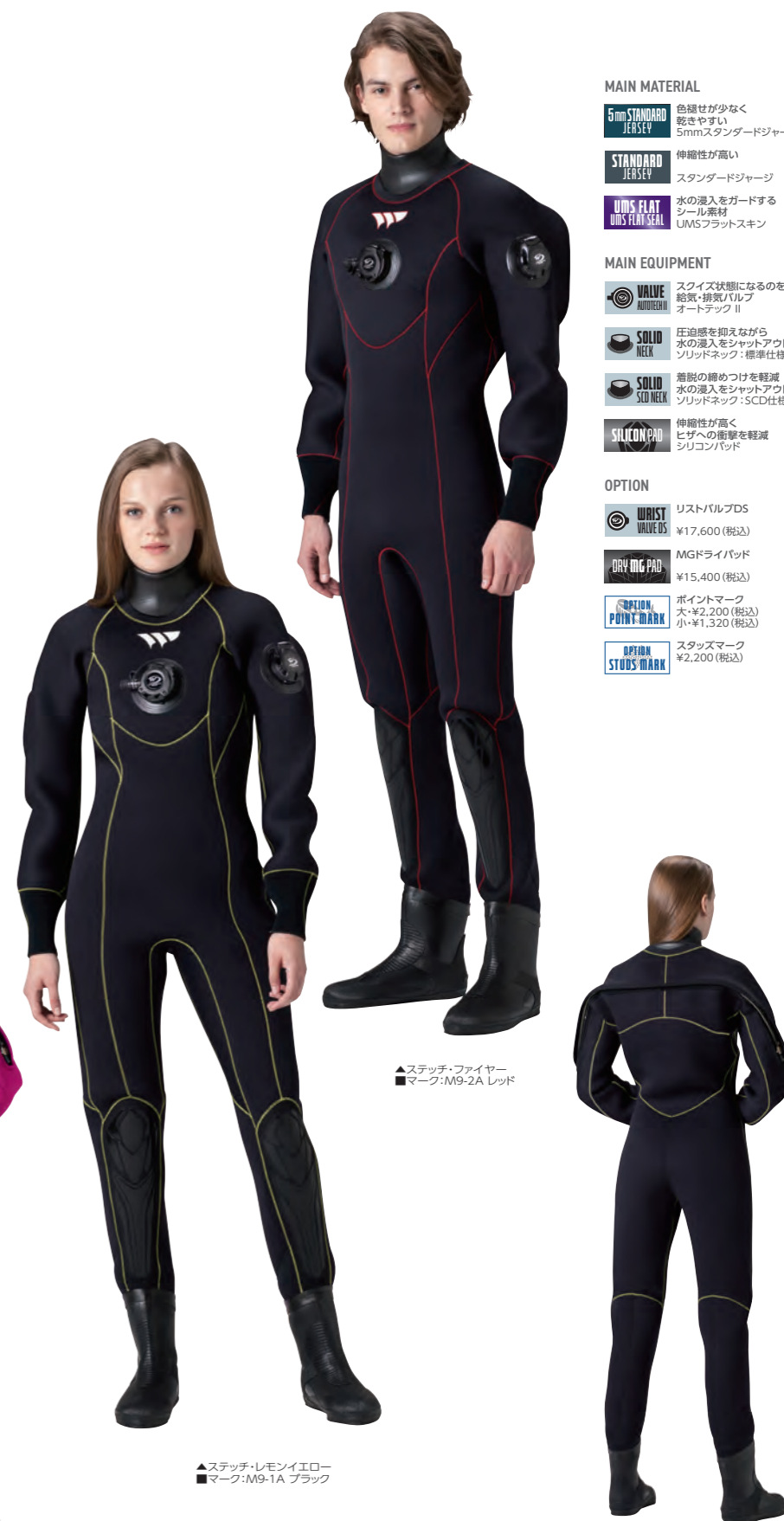
▲ステッチ・ファイヤー ■マーク:M9-2A レッド