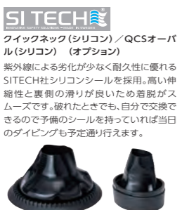
写真:QCSオーバル(シリコン)

クイックネック(シリコン)/QCSオーバル(シリコン) (オプション) 紫外線による劣化が少なく耐久性に優れるSITECH社シリコンシールを採用。高い伸縮性と裏側の滑りが良いため着脱がスムーズです。破れたときでも、自分で交換できるので予備のシールを持っていれば当日のダイビングも予定通り行えます。