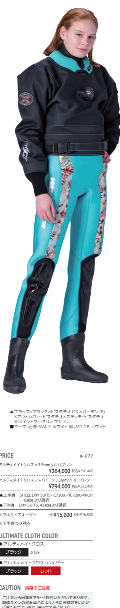
▲ブラック×ブラック×ピスタチオ(G)×ガーデン(P) ×アウトカパー・ピスタチオ×ステッチ・ピスタチオ ※ポイントマークはオプション ■マーク:右腕・W4-2 ホワイト 脚:M1-2B ホワイト

ご注文から出荷まで3~4週間いただいております。製造ラインの混み具合によりさらにお時間をいただく場合もございます。予めご了承ください。