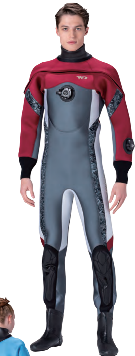
▲ネオグレイ×ワイン ×ベイズリー×シルバー×ホワイト ■マーク:M1-3A/3B ゴールド(小)

伸縮性の高いジャージ素材を採用し、フロント エントリードライスーツの運動性をアップ。