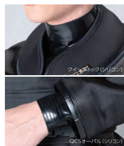
写真:クイックネック(シリコン)

INTERCROSS 腕マーク 腕マークには、ゴールド、ホワイト、ローズの3色をラインアップしました。