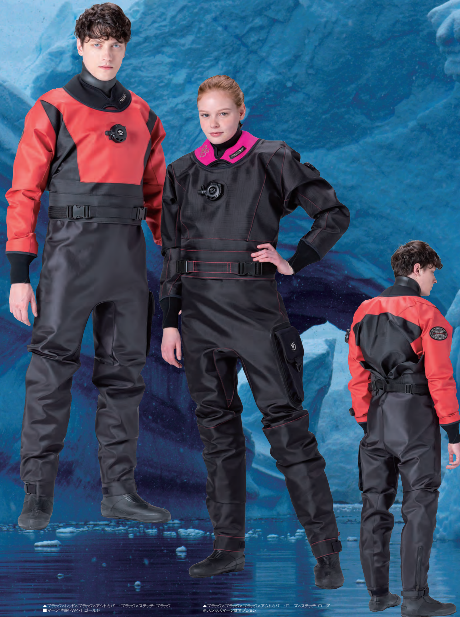
▲ブラック×レッド×ブラック×アウトカバー・ブラック×ステッチ・ブラック ■マーク:右腕:W4-1 ゴールド

ご注文から出荷まで3~4週間いただいております。製造ラインの混み具合によりさらにお時間をいただく場合もございます。予めご了承ください。