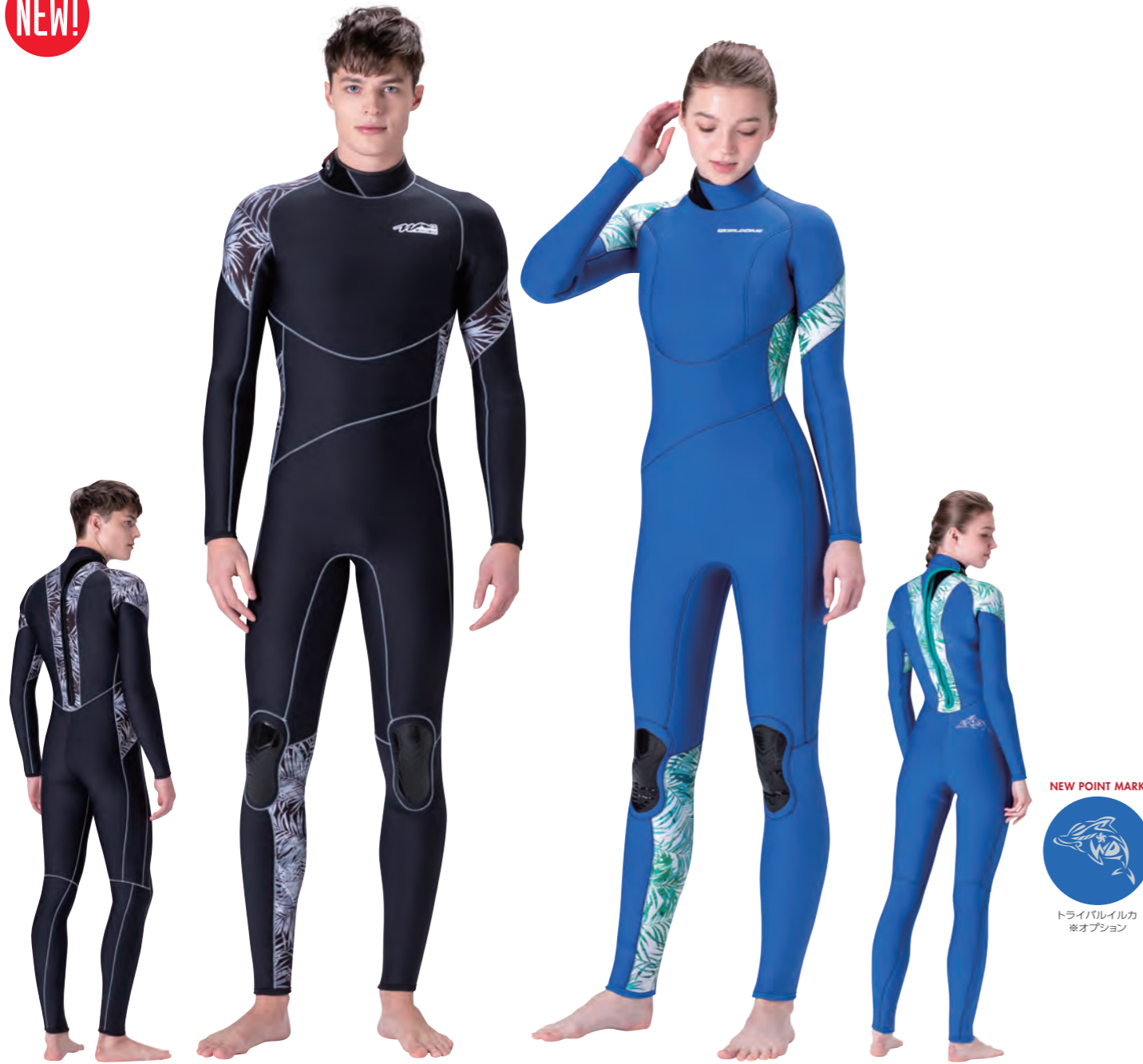
▲ブラック (FE) × パームモノ (P) × ステッチカラー: シルバー