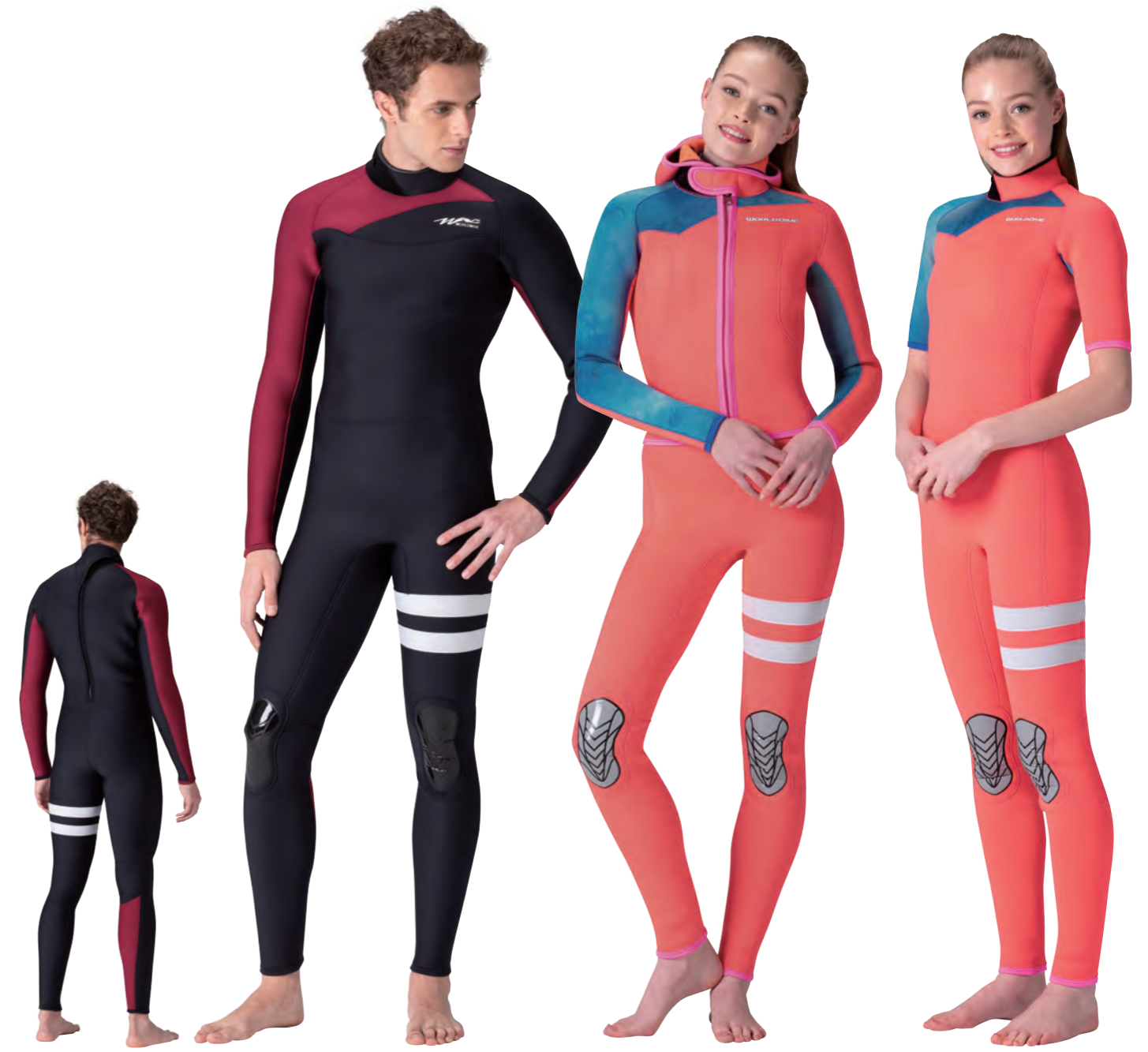
▲ブラック (FE) × マルーン (FE) × ホワイト (FE)