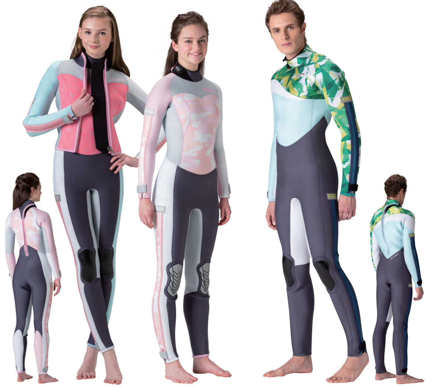
▲チャコールグレイ (FE) × シェルピンク (P) × シルバー (FE) × アイスブルー (FE) × ホワイト (FE) × シルバー (FE) + ファスナー・コーラルピンク × SCD ウッペン・ピンク