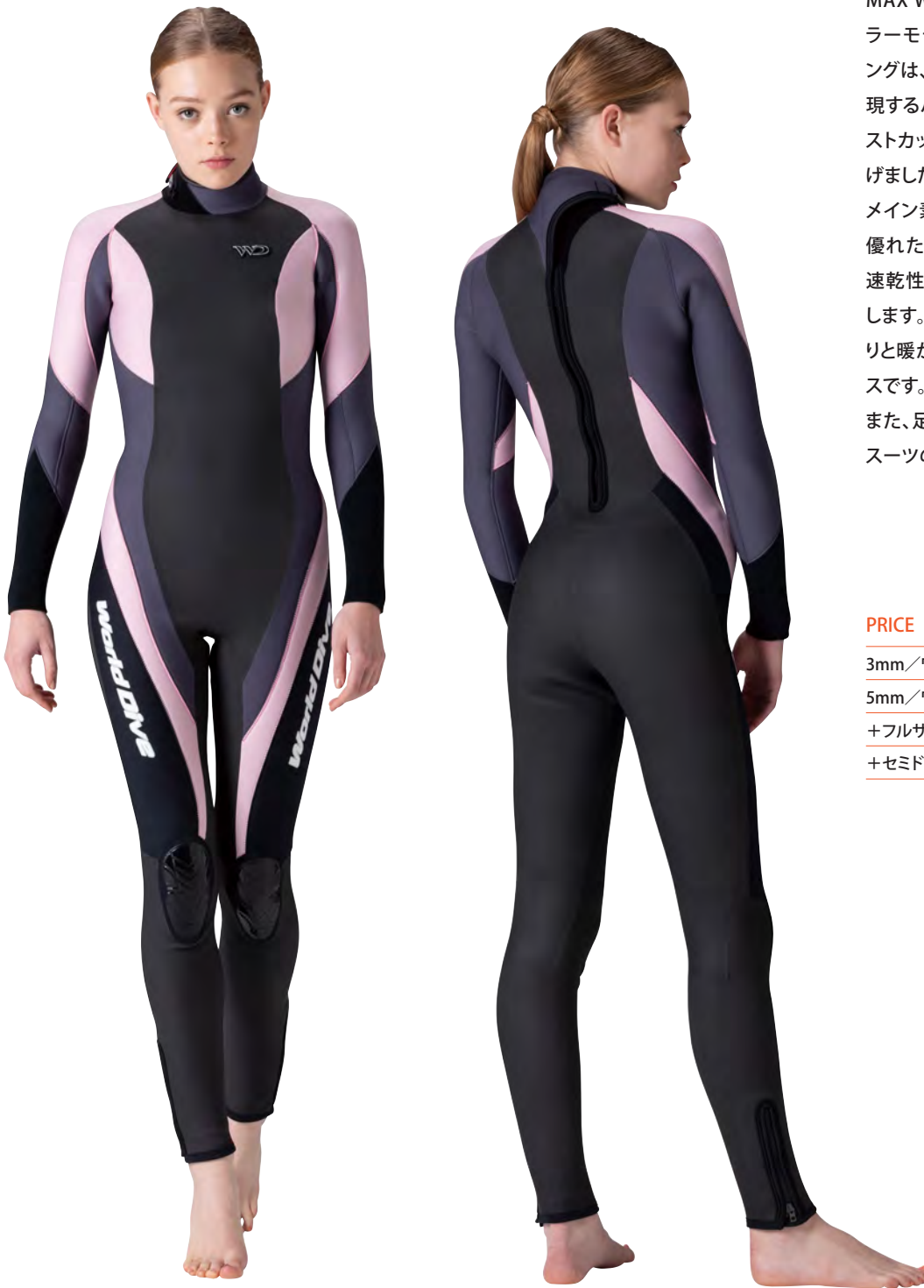
▲ビーチ (FE) × チャコールグレイ (FE) ※足首ファスナー標準装備

MAX WOMENS ウエットスーツのロングセラーモデルです。その人気No.1のスタイリングは、しなやかな女性のラインを美しく表現するパネル構成に、ウェイブシェイプ&バストカットを採用して絶妙のバランスで仕上げました。