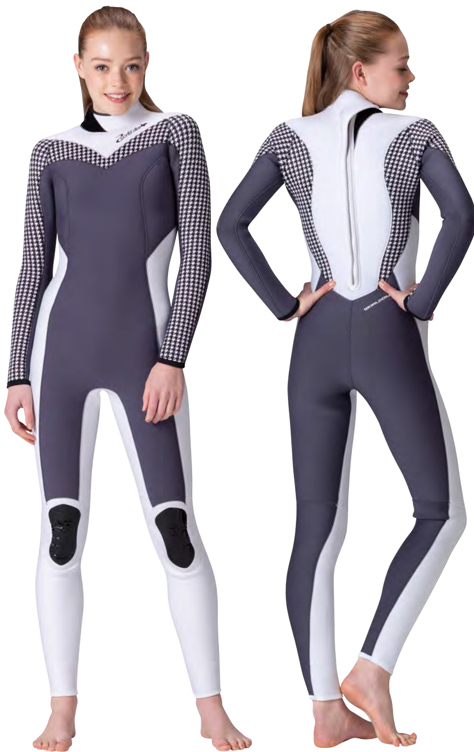
▲チャコールグレー (FE) × ホワイト (FE) × チドリブラック (P)

WOMENS専用デザインのカジュアルなシルエットは、エレガントにもキュートにも変身OKです。パネルカラーにお気に入りのプリント柄をうまくコーディネートして、可愛さも美しさも手に入れよう。