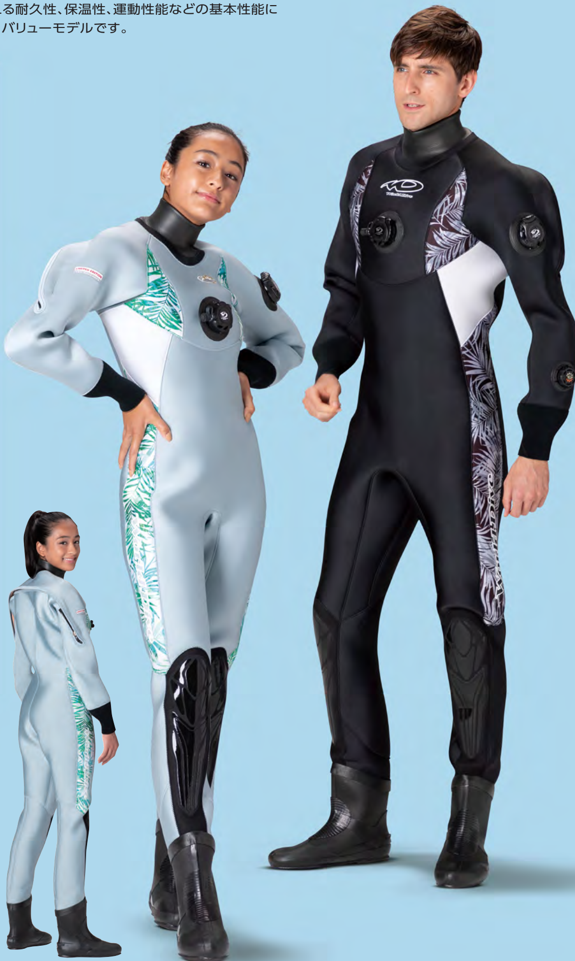
▲シルバー(G)+パームグリーン(P)+ホワイト(G)