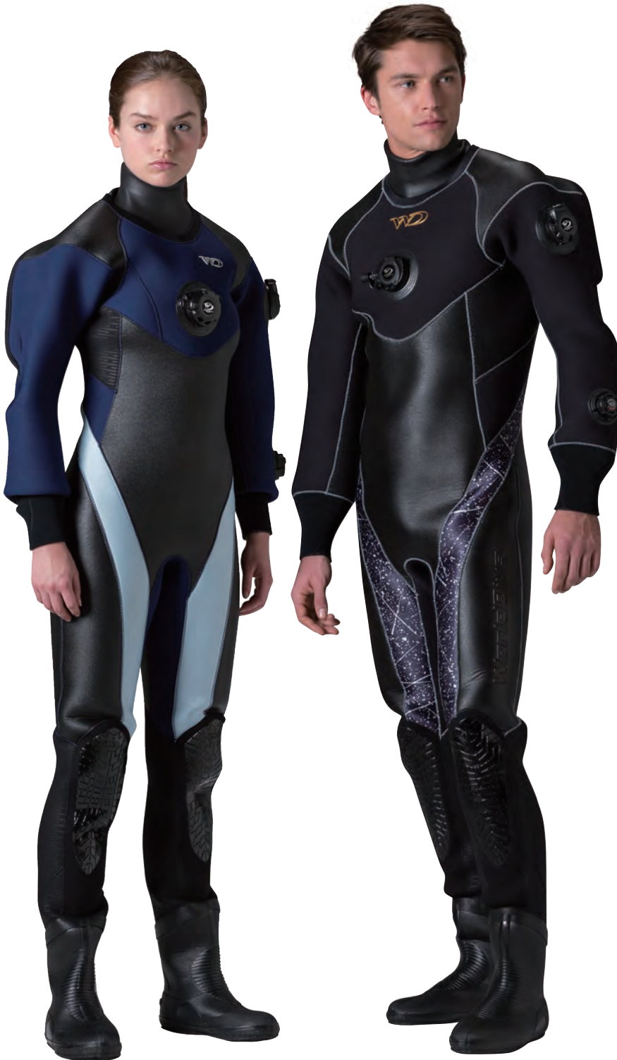
▲ネイビー(タフα)×アイスブルー(G)×ステッチ・ネイビー ▲ブラック(タフα)×ベイントホワイト(P)×ステッチ・シルバー

シーズン、ステージを選ばない。過酷な条件下での高い要求にも確実に応えるハイエンドドライです。