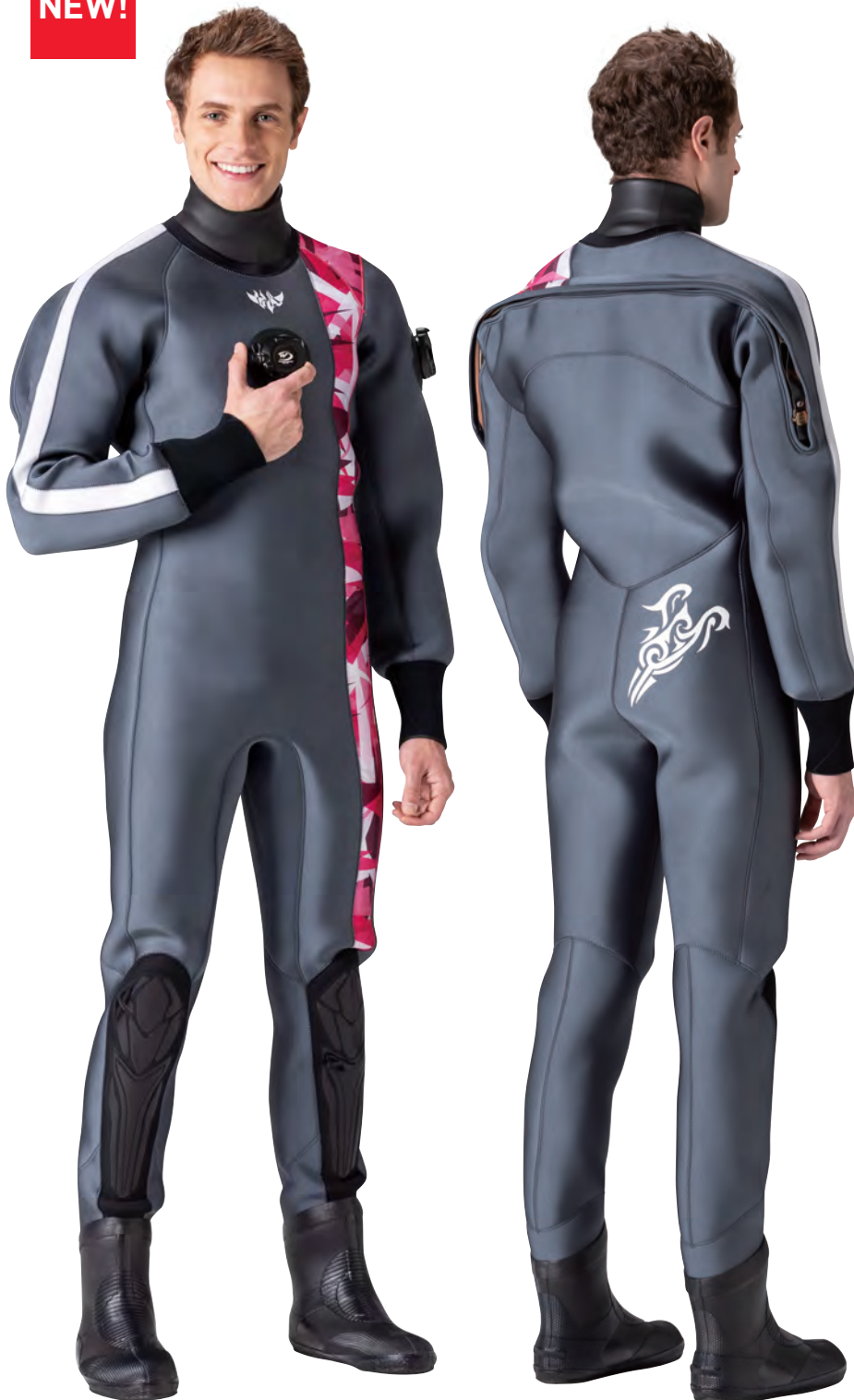
▲ネオグレイ(G)×クリスタルローズ(P)×ホワイト(G)

左肩からヒザ上までストレートに流れる縦ラインと、右腕の細いストレートラインがポイントの個性的なMENS専用デザインです。ベース色をシックなカラーリングにして、縦パネルに新しいプリント柄クリスタルなどをアレンジすれば、DCシリーズらしさを演出できます。