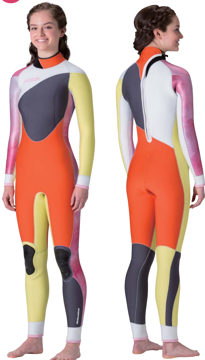
▲オレンジ(FE)×イエロー(FE)×タイダイピンク(P)×チャコールグレイ(FE)×ホワイト(FE) 手足首テープ・ビーチ

非対称デザインがポップでキュートな WOMENS専用デザインです。お好みのカラーリングに、新しいプリント柄のタイダイやチドリを自分流にアレンジしてお洒落に着こなそう。