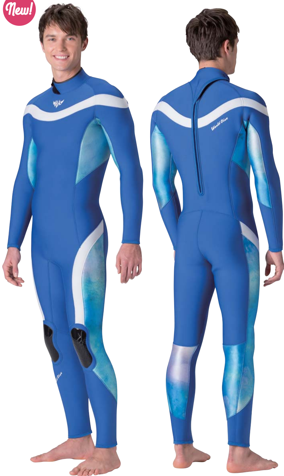
▲ブルー(FE)×ホワイト(FE)×タイダイブルー(P)

新しいプリント柄タイダイがマッチするMENS専用スーツをテーマに、脇から腕裏、太ももサイドからふくらはぎに流れるパネルと、肩から胸、背中へと回り込むラウンドラインと腰から膝までのラインで、サーファーライクなデザインに仕上げました。