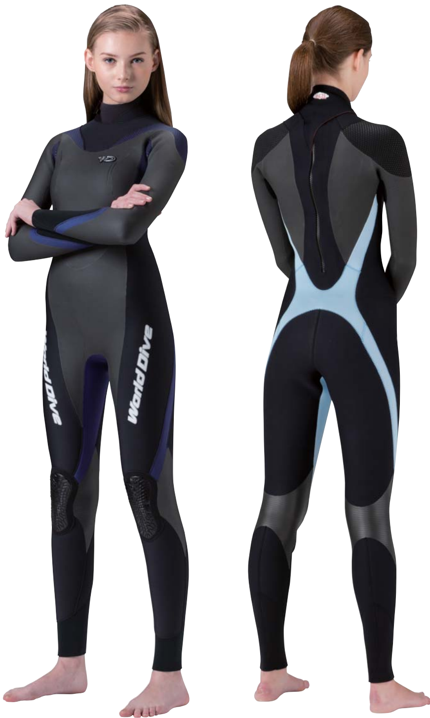
▲ネイビー (FE) × ネイビー (ZF)