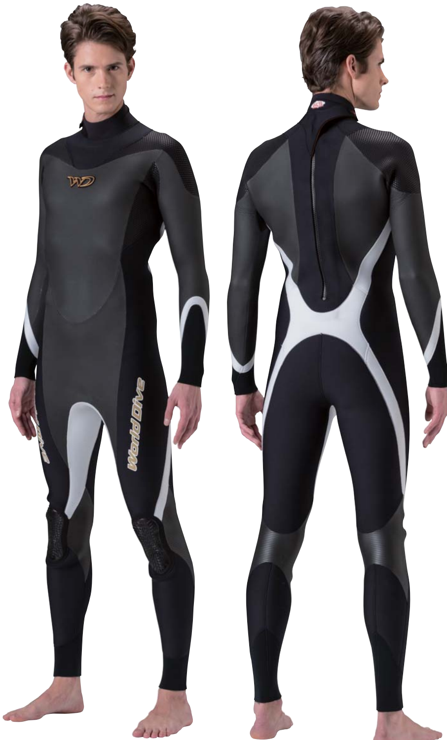
▲ホワイト (FE) ×ブラック (ZF)