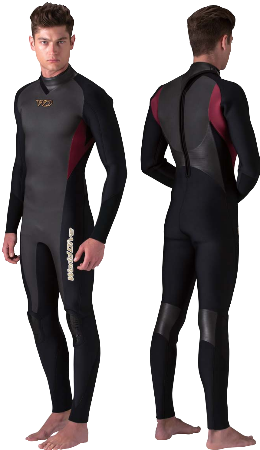
▲ワイン(グロッシーファイバー)

つねにトップクラスの人気をキープする定番モデルZEW840に、圧縮歪みの少ないハードラバーを採用し、着心地よりも耐久性を重視したプロ仕様モデル。