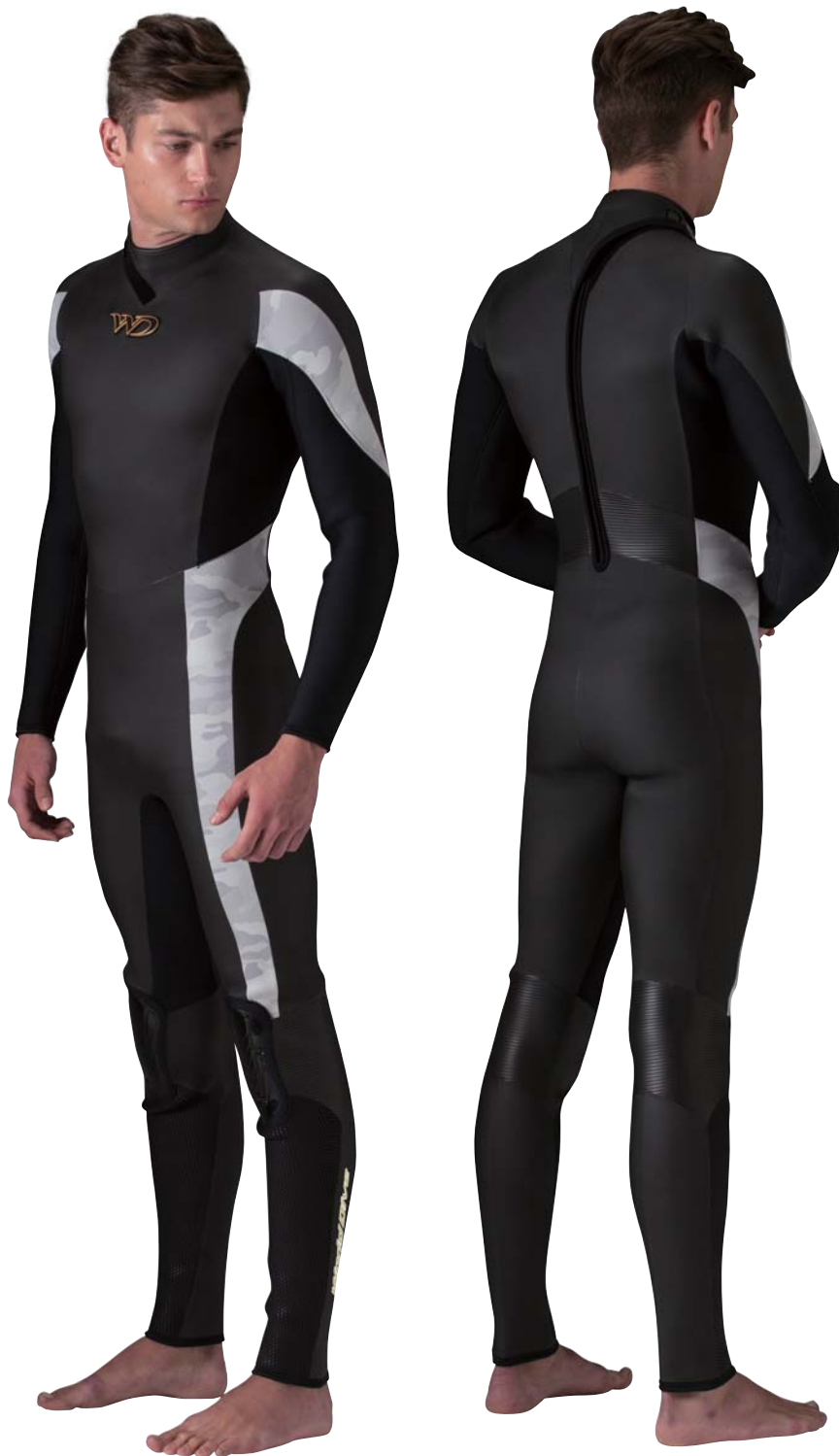
▲ブラック(FE)×ライトカモグレイ(P)×ブラック(ZF)