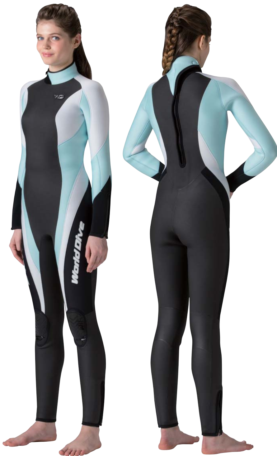
▲ホワイト(FE)×アイスブルー(FE) ※足首ファスナー標準装備、手首ファスナーはオプション

MAX WOMENS ウエットスーツのロングセラーモデルです。その人気No.1のスタイリングは、しなやかな女性のラインを美しく表現するパネル構成に、ウェイブシェイプ&バストカットを採用して絶妙のバランスで仕上げました。