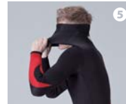
⑤リアパネルを首に通して