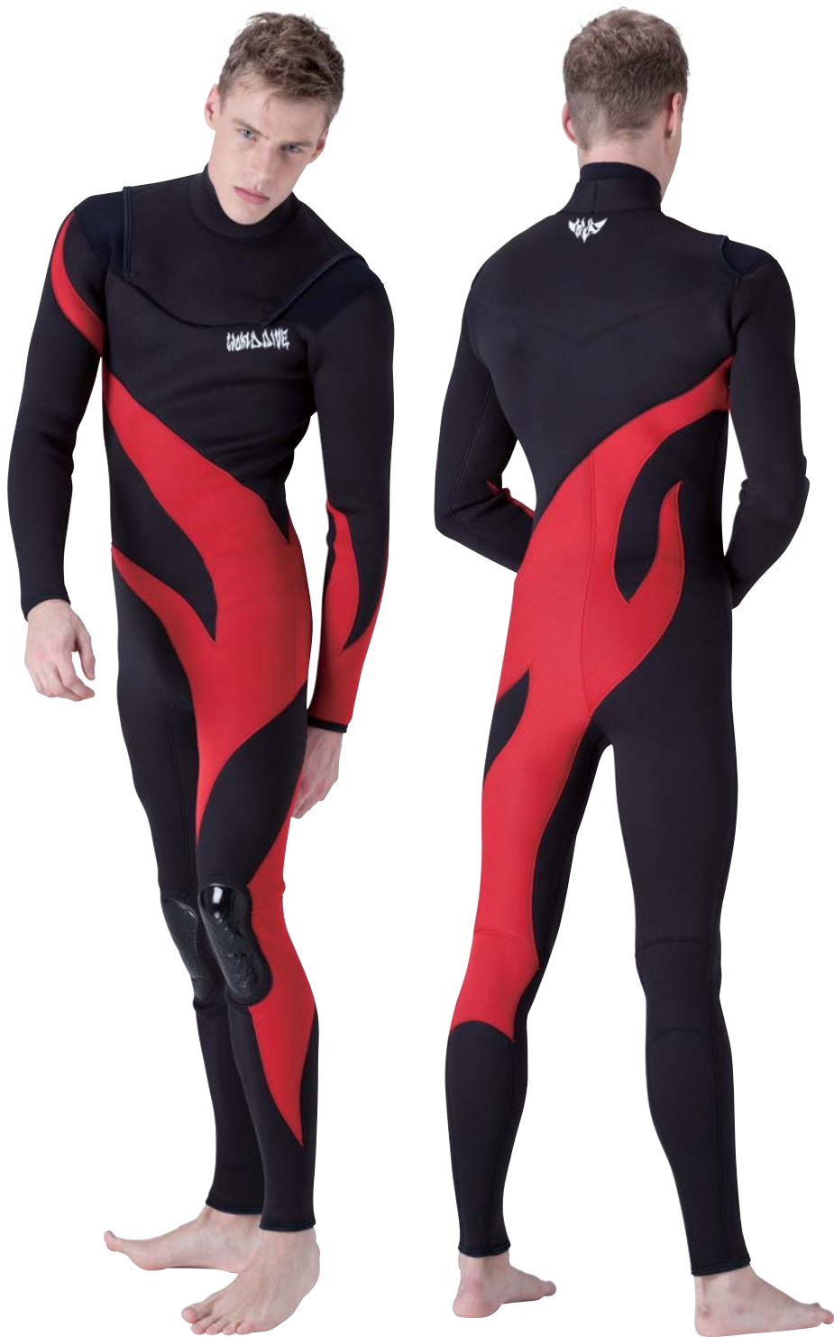
▲ブラック(SJ)×ファイヤー(SJ)