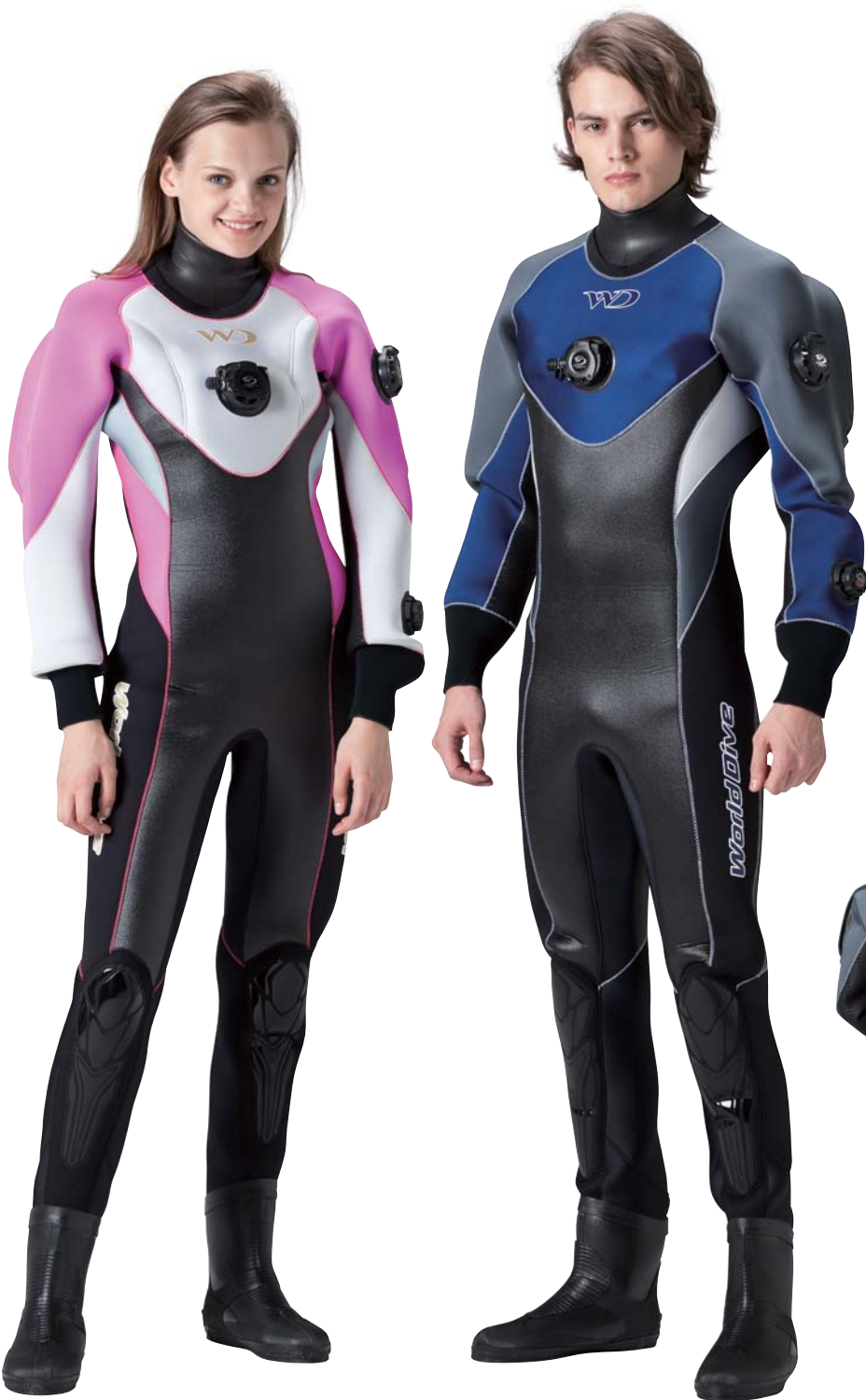
▲ホワイト(G)×ローズ(G)×シルバー(G)×ブラック(タフα) ×ステッチ・ローズ