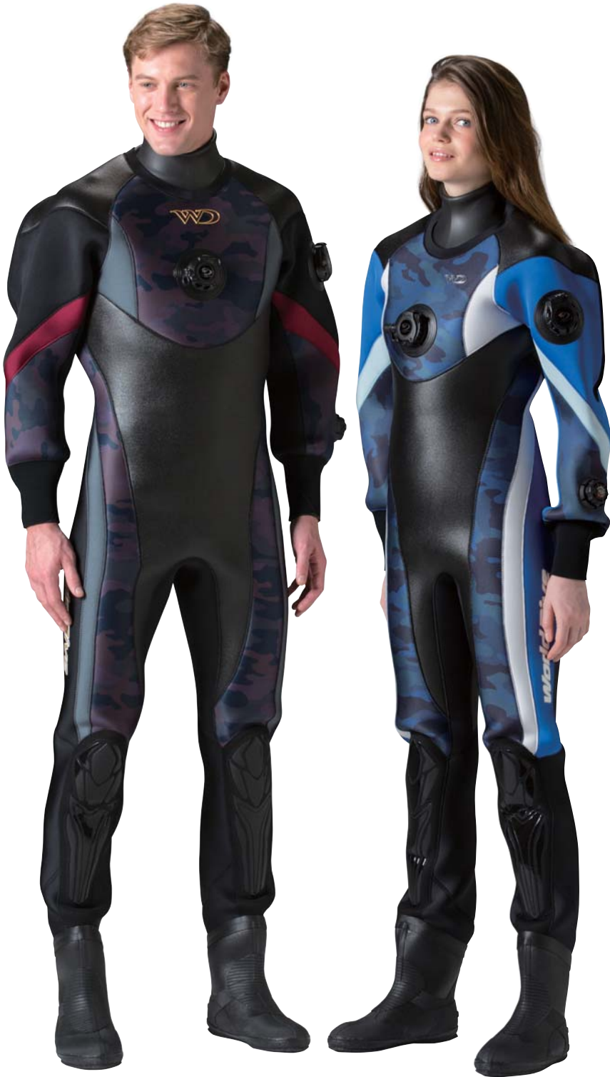
▲ダークカモブラック(P)×ブラック(G) ×ネオグレイ(G)×ワイン(G)