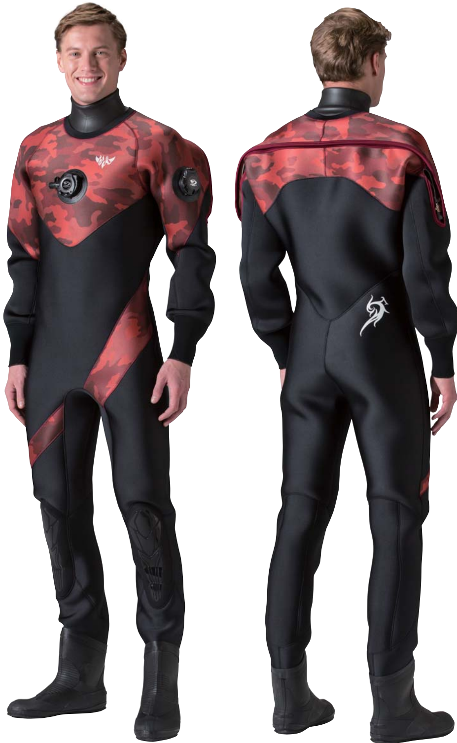
▲ブラック(G)×ダークカモレッド(P)

胸回りのオーソドクスなパネルとウエストから流れる斜めのラインに、バスト&ヒップにトライバルマークを配したメンズ専用モデルです。カモフラージュ柄を選べばDCシリーズらしい個性的なデザインに変化。裏地は保温性の高い起毛素材マルチエラステックスか抗菌防臭機能を備えたリブフレッシュPから。