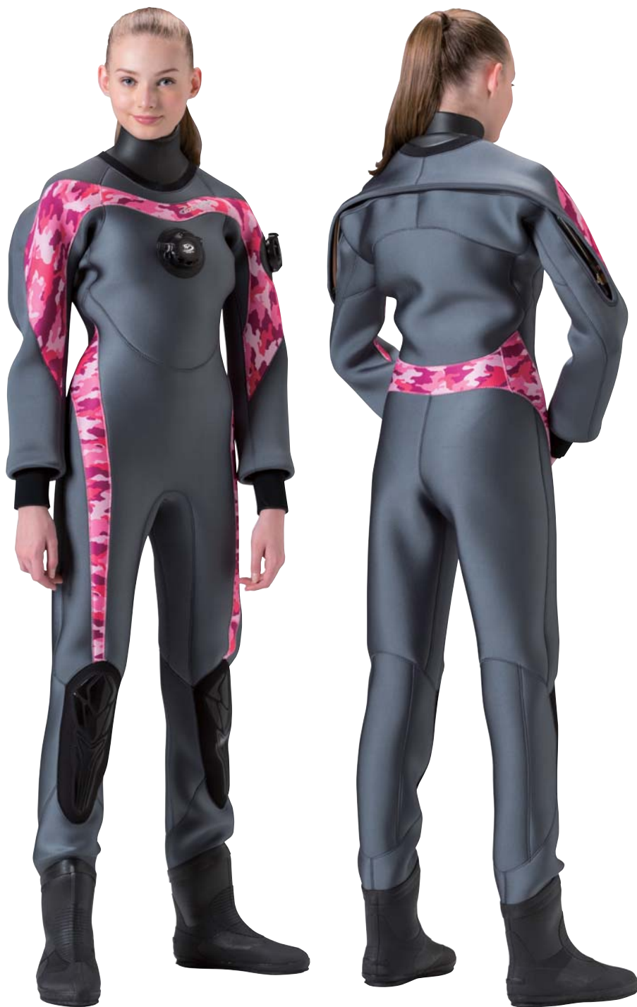
▲ネオグレイ(G)×フローラル(P)×フローラル(P)

コーディネート幅を広げるボタニカル柄やカモフラ柄もポイント使いでカラーをシンクろさせればレディなスタイリングに。胸から袖にかけてのラインもプリント柄を選択できるようにしました。