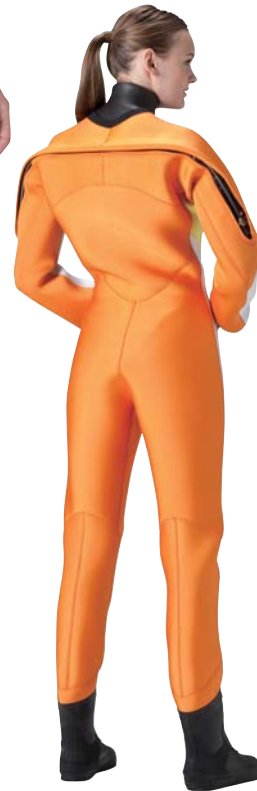
▲ネオグレイ(G)×ホホワイト(G)×アイスブルー(G)

■UMSフラットスキン／フラットスキンにウレタン樹脂コーティング。肌に密着して水の浸入を抑えスムーズな着脱も約束します。