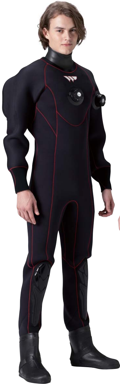
▲ステッチ・ファイヤー