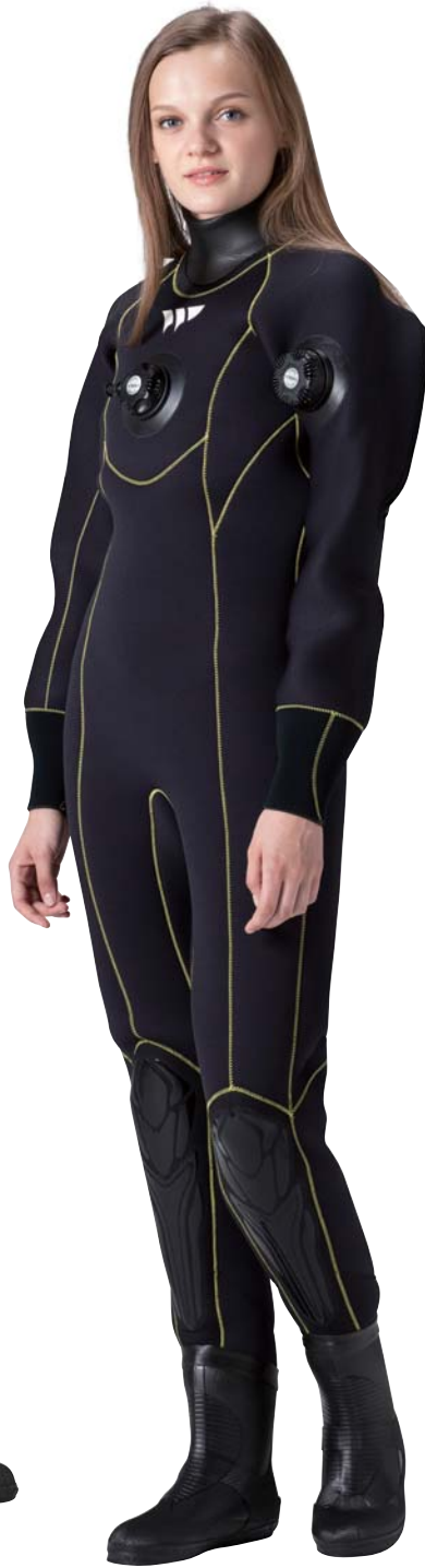
▲ステッチ・レモンイエロー

色々なギアを揃えなければならない新人ダイバーのために、デザイン&カラーをシンプルにするなど徹底してバリュープライスを追求した嬉しいスーツ。素材は両面5ミリスタンダードジャージ。