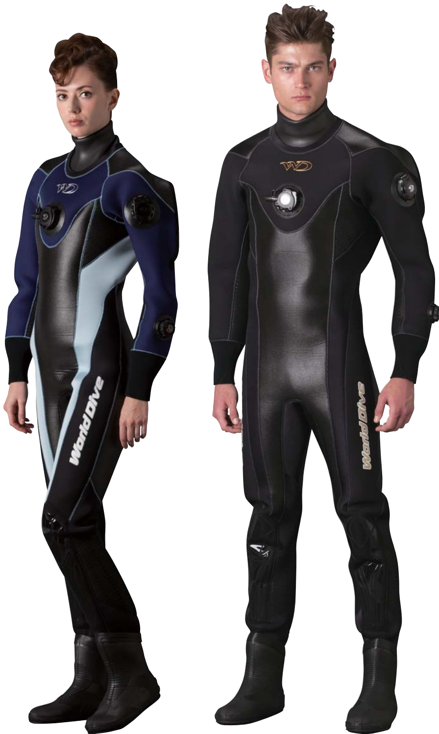
▲ネイビー×アイスブルー×ブラック×アイスブルーステッチ