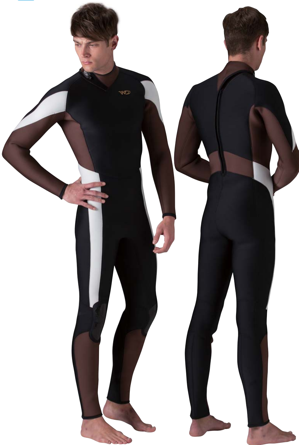
▲ブラック×ブラウン×ホワイト