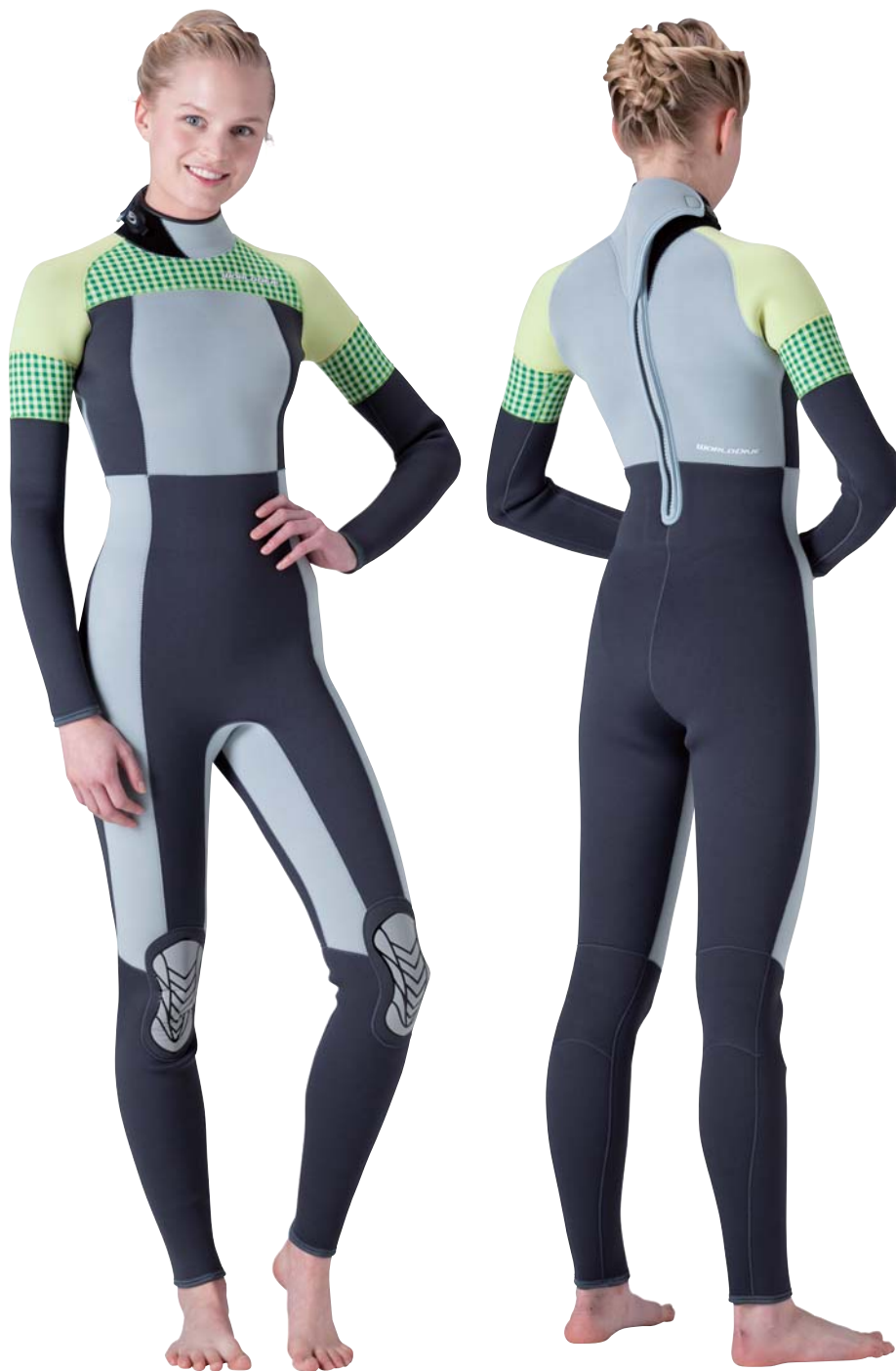
▲チャコールグレイ×シルバー×イエロー×チェックグリーン(SJ)

プリントパターンが嬉しいDCシリーズ。 ポイントカラーに合わせてギンガムチェック をチョイスすればカジュアルな味付けもおま かせ。チャーミングな海ガールの誕生です。