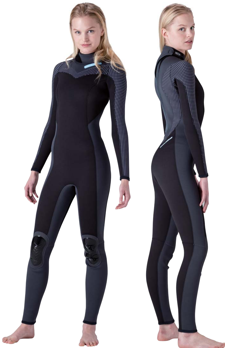
▲ブラック×チャコールグレイ×ドットブラック(SJ)