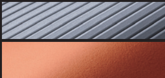
表:フレキシブルスキン/裏:マルチエラストックス

フラットスキン表面にスリット状にエンボス加工を施した屈伸などの運動性に優れた素材。裏素材は、伸縮性、超撥水性、保温性、そして肌触りの良さで抜群の快適性を約束するマルチエラストックス。